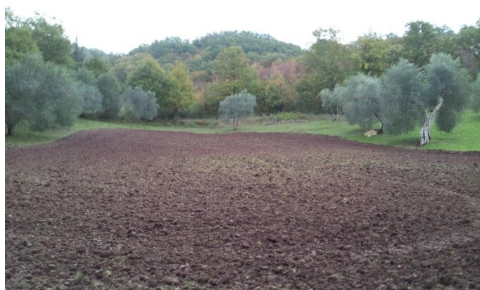
Feld B, Westseite