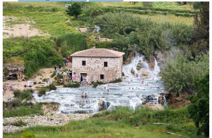
Thermalquelle von Saturnia. Mulino Wasserfall