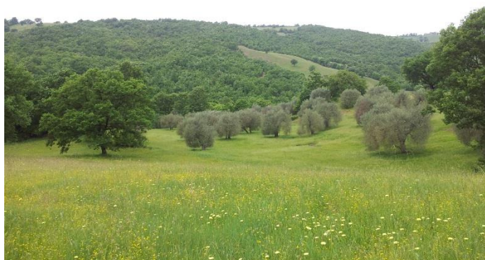
Feld A, Ostseite