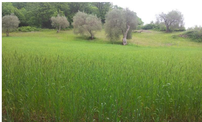
Feld B, Nordseite