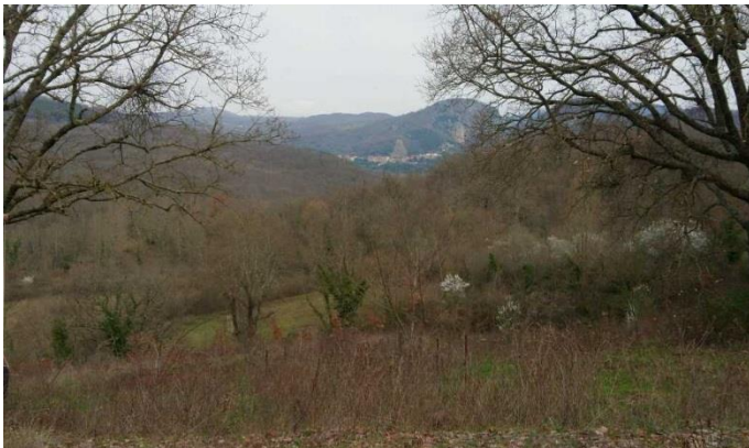
Feld mit Blick auf Roccalbegna