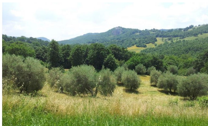
Feld A, Nordseite