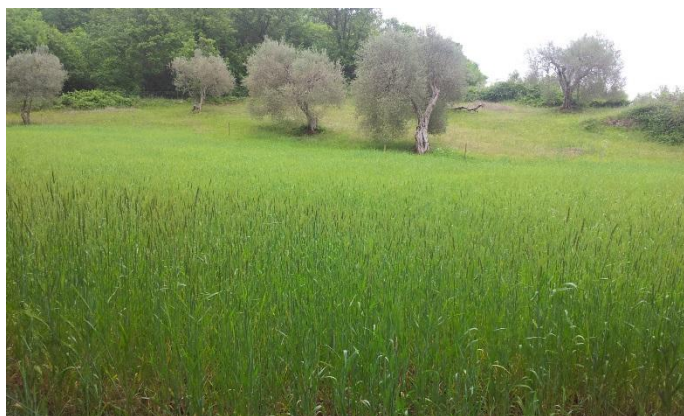
Veld B, noordzijde