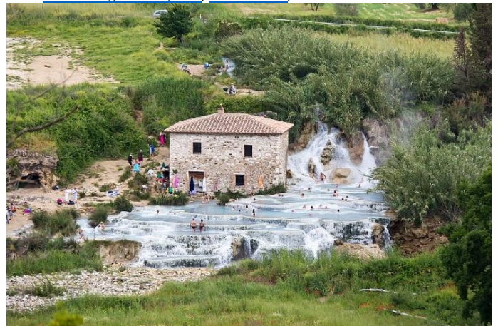
Thermale baden van Saturnia. Mulino-waterval