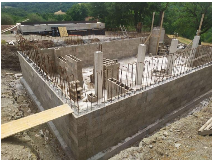
Funderingen en keldermuur

Als we de vraagprijs hierbij optellen, zou een compleet huis € 550.000 kosten (optie 2). Ter vergelijking: een ecologisch huis met grond in de omgeving heeft een marktwaarde van meer dan 3.000 €/m 2 en zou in totaal € 800.000 kosten.