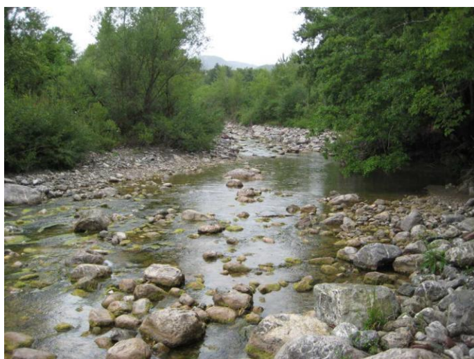
De rivier Albegna