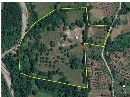
Kaart van het terrein

Het huis is omgeven door 6,3 hectare grond met monumentale olijfbomen en een jonge boomgaard met pruimen-, amandel-, perzik- en appelbomen. De rest is akkerland of geschikt voor het begrazing. Landbouwwerktuigen en -gereedschap zijn afzonderlijk verkrijgbaar.