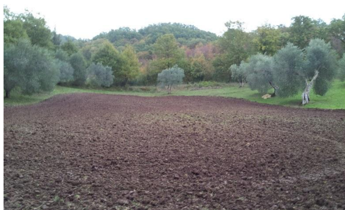
Veld B, westzijde